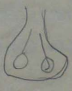
Fig 3 villen